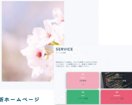
◀さくら印刷 新ホームページ